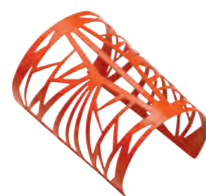
Inka karkötő Átmérője: 6,5 cm. 28454 1999,-