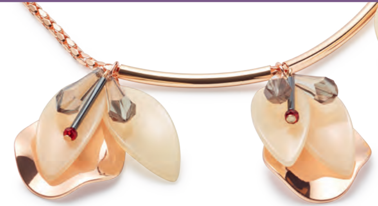
TREND: FÜLBEVALÓ + FÜLDÍSZ Modern és extravagáns

A 2018-as tavaszi kollekció a 6-os katalógus-időszakig lesz elérhető!