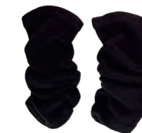
Vique ujjatlan kesztyű Mérete: 26 cm (hossz) 9 cm (nyitott rész szélessége). Anyaga: 100% akril fonal. 29765 1999,-