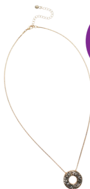
Vique Classic nyaklánc Mérete: 43 cm (H) + 6 cm, 2,2 cm (medál átmérője). Anyaga: fémek, akril kövek. 29767 1999,-