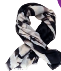
Classica sál Mérete: 190x90 cm. 29105 2999,-