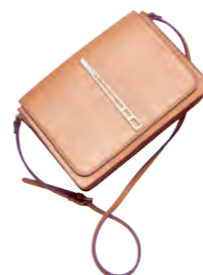
Lupine táska Mérete: 25.5x9x18.5 cm. 29335 5999,-