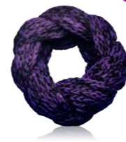
Delicate kötött körsál Mérete: 14x70 cm (körméret). 29245 3999,-