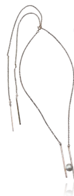
Extravagant nyaklánc hátmedállal Nikkelérzékenység esetén is használható. Hossza: 54 cm. 29283 2999,-