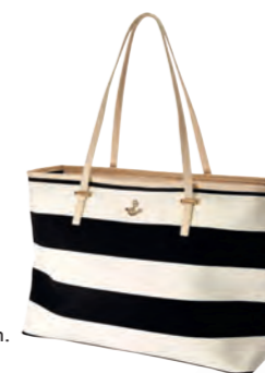
Classica Nautica táska Mérete: 35x15x27 cm. 29484 7999,-