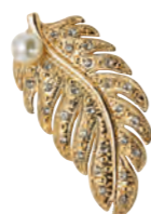
Feather nyaklánc és brosz Nikkelérzékenység esetén is használható. A lánc hossza: 76,5+6 cm. A medál mérete: 2,6x5,5 cm. 29219 1999,-