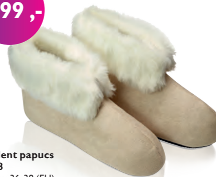
Opulent papucs 36-38 Mérete: 36-38 (EU). 28645 3799,-