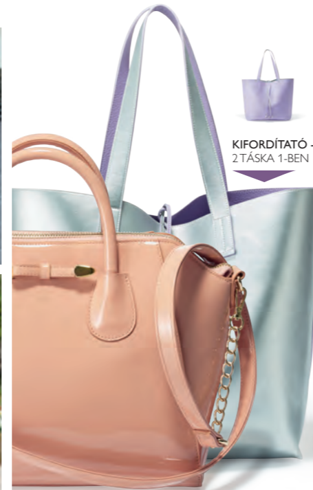
KIFORDÍTÁTO - 2 TÁSKA 1-BEN