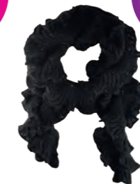
Vique sál Mérete: 130 cm x 20 cm. Anyaga: poliészter, akril mohair, PET flitter. 29764 3499,-