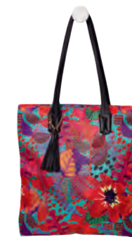
Vibrant táska Mérete: 32x8x36 cm. 29490 6499,-