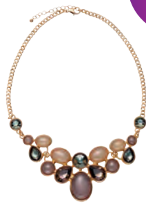
Savanna nyaklánc Nikkelérzékenység esetén is használható. Hossza: 45 cm + 5,5 cm. 29083 2299,-