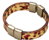
Imana karkötő Nikkelérzékenység esetén is használható. Átmérő: 6 cm. Szélesség: 1,5 cm. 29080 2299,-