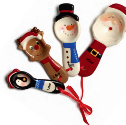
Wonderland mérőkanál szett Térfogat: 1,25 ml, 2,5 ml, 5 ml, 15 ml. 28620 2499,-