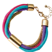
Vibrant karkötő Mérete: 19x3 cm. 29489 1999,-