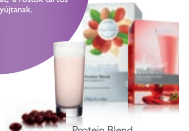
Protein Blend fehérjepor és Ízesített italporok

Fokozza erőnlétét és energiáját kiváló minőségű makrotápanyagokkal: az Ízesített italporokban és a Protein Blend fehérjeporban megtalálható fehérjével és rostokkal. A fehérjék elősegítik a szervezet sejtjeinek megújulását, a rostok tartós energiát nyújtanak.