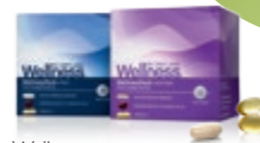
Wellness-csomag nőknek és férfiaknak

A táplálkozás alapja esszenciális mikrotápanyagokkal: vitaminokkal, ásványi anyagokkal, Omega 3-zsír-savakkal és astaxanthinnal. Ezeket mindennap szedheti, így aktivizálhatja szervezetének működését, pótolhatja a hiányzó tápanyagokat és erősítheti immunrendszerét. A Wellness-csomag mindezen esszenciális tápanyagokat tartalmazza, praktikus egy napi adagot tartalmazó tasakokban.