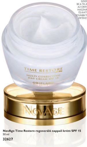
NovAge Time Restore regeneráló nappali krém SPF 15 50 ml 32627