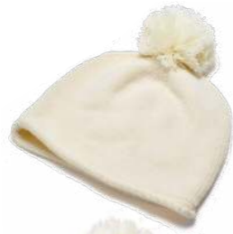
To You sapka dobozban Anyaga: akril, FSC- minősítésű papírdoboz. Egy méret. 31982 3499,- 1799,-