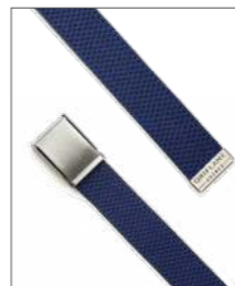
Love Men öv férfiaknak Anyaga: poliészter, fém. Nikkelérzékenység esetén is viselhető. Mérete: 120x3,8 cm. 37970 2999,- 1999,-