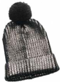
New York sapka Anyaga: akril. Mérete: 24,5x22 cm. Kerülete: 69 cm. 31873 2999,- 1999,-