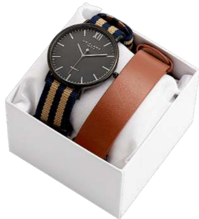
Férfi karóra szett Anyaga: cinkötvözet foglalat, üveg, rozsdamentes acél hátlap, nejlon, PU. Óralap mérete: 4,1 cm. Pánt mérete: 26,8 (H) x 1,9 (SZ) cm. 39993 10999,- 6999,-