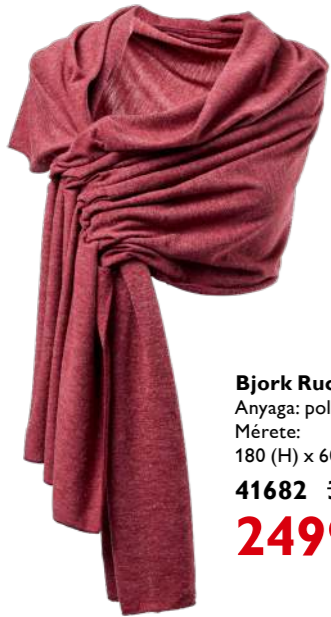
Bjork Ruched kendő Anyaga: poliészter, viszkóz. Mérete: 180 (H) x 60 (SZ) cm. 41682 3999,- 2499,-