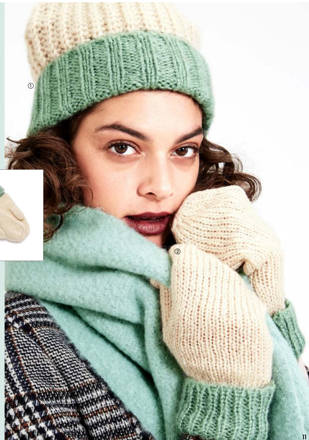
② Laura egyujjas kötött kesztyű Anyaga: akril. Mérete: 25x9 cm, hajtóka: 5 cm. 31539 1999,- 1299,-