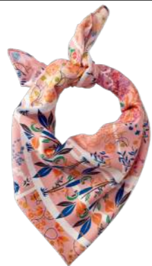
Love Floral sál Anyaga: 40%-ban újrhasznosított poliészter. Mérete: 90x90 cm. 37966 2999,- 1999,-