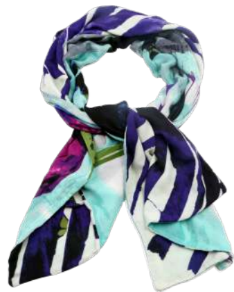
Spirit sál Anyaga: 100% viszkóz. Mérete: 170x60 cm. 29439 4999,- 3499,-